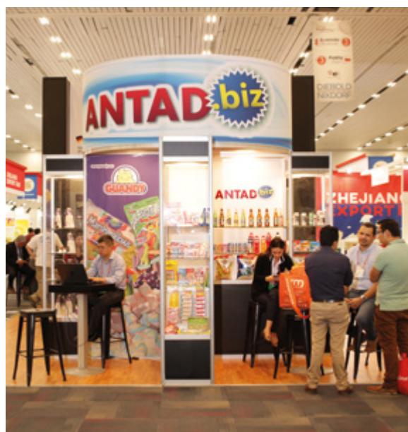
Messestand in Guadalajara, Mexiko, 2018

Mexiko, Guatemala, Honduras und Deutschland haben von 2015 bis 2019 die kleinen und mittelständischen zentralamerikanischen Zulieferer mexikanischer Supermärkte und Lebensmittelläden gefördert. Über die virtuelle Plattform ANTAD.biz des mexikanischen Einzelhandelsverbands haben mehr als 500 Partnerunternehmen leichter Zugang zum mexikanischen Markt bekommen, sich zur Einhaltung ökologischer Standards verpflichtet und ihre Position innerhalb der Wertschöpfungskette ausgebaut. Die Vernetzung ermöglicht zudem Erfahrungsaustausch, gegenseitiges Lernen und die Entwicklung gemeinsamer Lösungen zur Verbesserung der Wettbewerbsfähigkeit des Einzelhandels. Ein neues, auf wirtschaftliche, ökologische und soziale Nachhaltigkeit gerichtetes Geschäftsmodell entsteht.