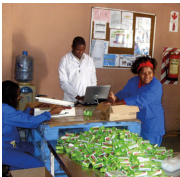
Qualitätskontrolle in einem mosambikanischen Unternehmen

Inmetro, das nationale Staatsinstitut für Messwesen in Brasilien, hat in Zusammenarbeit mit der deutschen Entwicklungszusammenarbeit das mosambikanische Staatsinstitut INNOQ im Bereich von Normung, Akkreditierung, Messwesen und Konformitätsbewertung unterstützt. Schwerpunkt waren die Ausbildung und Beratung durch brasilianische Fachleute. Die brasilianische Entwicklungsagentur Agência Brasileira de Cooperação (ABC) und das BMZ finanzierten die Maßnahmen. INNOQ wurde so institutionell und technisch im Bereich der Qualitätssicherung gefördert, zum Schutz von Gesundheit, Umwelt sowie Verbraucherinnen und Verbrauchern.