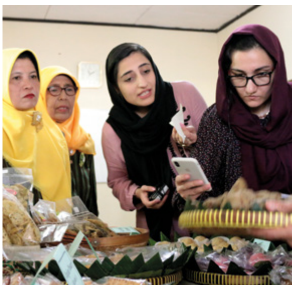
Afghanische Vertreterinnen der regionalen Verwaltung lernen von Frauen hergestellte Produkte indonesischer Heimindustrie kennen.

Von 2018 bis 2020 haben das afghanische Frauenministerium, das Ministerium für Frauenförderung und Kinderschutz in Indonesien und die deutsche Entwicklungszusammenarbeit Konzepte für wirtschaftliche Teilhabe von Frauen entwickelt. Grundlage waren die Erfahrungen der Heimindustrie in verschiedenen Regionen Indonesiens. Die afghanischen Partner leisteten wichtige eigene Beiträge durch ihre Kenntnisse der afghanischen Kultur und Normen. Das Modul „Schritte zur Entwicklung der Heimindustrie“ wurde in der nordafghanischen Provinz Samangan probeweise angewendet. Dabei wurde auch ein Verpackungszentrum für Produkte von Frauen errichtet. Die Erfahrungen aus diesem Projekt werden nun mit Blick auf die jüngsten politischen Entwicklungen regierungsfern fortgesetzt.