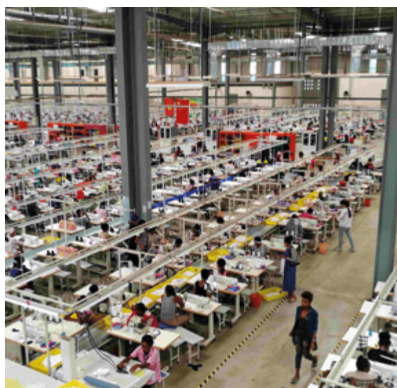
Chinesische Textilproduktion in Äthiopien

2019 stammten 60 Prozent der neuen ausländischen Direktinvestitionen in Äthiopien aus China. Die stark wachsende Textilindustrie spielt dabei eine wichtige Rolle. Äthiopien und Deutschland kooperieren in einem Programm für die nachhaltige Textilproduktion. Die 2020 begonnene äthiopisch-chinesisch-deutsche Dreieckskooperation zum gleichen Thema verbessert die Umwelt-, Sozial- und Arbeitsstandards des äthiopischen Textilssektors durch Kapazitätsentwicklung und Bewusstseinsbildung bei chinesischen Investoren und Fabrikmanagern sowie ihren lokalen Geschäftspartnern. Ein wichtiger Partner ist neben den äthiopischen und chinesischen Textilindustrieverbänden auch die UNIDO. Die Erfahrungen aus der Dreieckskooperation sollen in anderen Teilen Afrikas und Asiens repliziert werden.