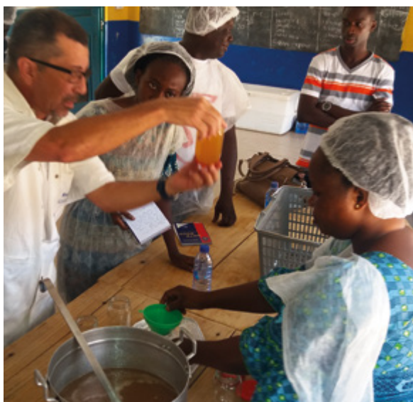
Trainingskurs für Cashew-Verarbeitung durch brasilianische Expertinnen und Experten in Ghana

Brasilien und Deutschland haben gemeinsam mit dem ghanaischen Ministerium für Ernährung und Landwirtschaft (MOFA) durch die Einführung von ertragreicheren und qualitativ besseren Cashew-Sorten und effizienteren Cashew-Verarbeitungstechnologien die Einkommen von ghanaischen Bauernhaushalten gesteigert, die Armut der Bauernfamilien gemindert und ihre Ernährungssicherheit erhöht. Außerdem hat das Projekt durch das Pflanzen von Bäumen zur Minderung des Klimawandels beigetragen und zusätzliche Einkommens- und Arbeitsmöglichkeiten für Frauen geschaffen.