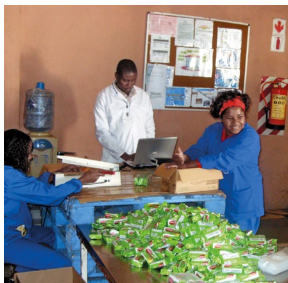
Control de calidad en una empresa mozambiqueña

Inmetro, el Instituto Nacional de Metrología del Brasil, apoyó en colaboración con la cooperación alemana para el desarrollo el instituto nacional mozambiqueño INNOQ en el área de la normalización, acreditación, metrología y evaluación de la conformidad. El proyecto se centró en la formación y el asesoramiento por expertas y expertos brasileños. La Agência Brasileira de Cooperação (ABC) y el BMZ financiaron estas medidas. De este modo, el INNOQ ha sido fomentado a nivel institucional y técnico en el área de aseguramiento de la calidad, en beneficio de la protección de la salud, del medio ambiente y de los consumidores y consumidoras.