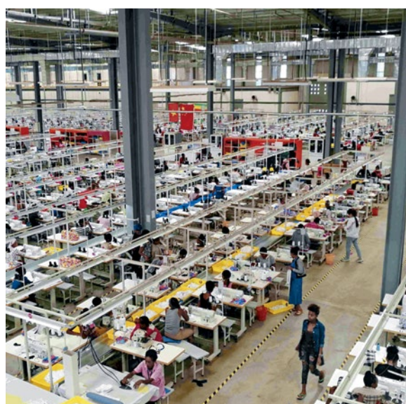
Producción textil china en Etiopía

En 2019, el 60 por ciento de las nuevas inversiones extranjeras directas en Etiopía provenía de China. La industria textil de fuerte crecimiento desempeña un papel particular en este contexto. Etiopía y Alemania están cooperando en un programa de producción textil sostenible. La cooperación triangular etíope-chino-alemana en esta temática se inició en 2020 y mejora los estándares ambientales, sociales y laborales del sector textil etíope gracias al desarrollo de capacidades y la concientización de inversores y gerentes de fábricas chinas, así como sus socios comerciales locales. Aparte de las asociaciones de las industrias textiles de Etiopía y China, otro socio importante es la Organización de las Naciones Unidas para el Desarrollo Industrial (ONUDI). Se prevé replicar las experiencias adquiridas en esta cooperación triangular en otras partes de África y Asia.