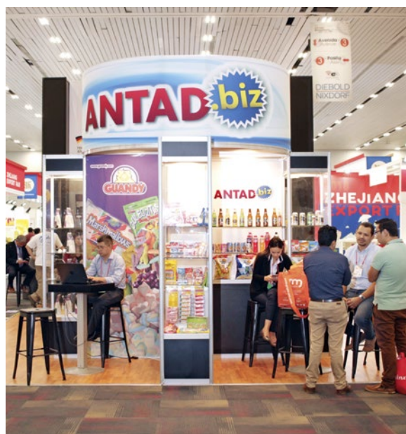
Stand de feria en Guadalajara, México, 2018

De 2015 a 2019, México, Guatemala, Honduras y Alemania fomentaron a los pequeños y medianos proveedores centroamericanos de tiendas de alimentos y supermercados mexicanos. A través de la plataforma virtual ANTAD.biz de la Asociación Nacional de Tiendas de Autoservicio y Departamentales de México, más de 500 empresas socias lograron acceder más fácilmente al mercado mexicano, se comprometieron a cumplir estándares ecológicos y consolidaron su posición en la cadena de valor. La interconexión permite además el intercambio de experiencias, el aprendizaje mutuo y el desarrollo de soluciones comunes para mejorar la competitividad del comercio minorista. Surge un nuevo modelo de negocio enfocado en la sostenibilidad económica, ecológica y social.