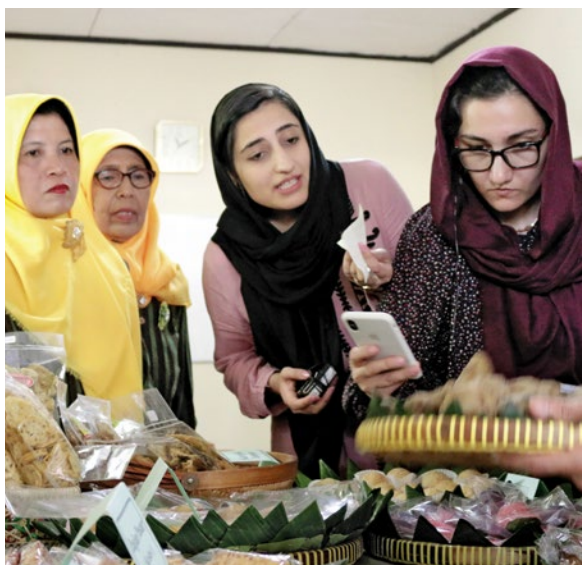
Representantes afganas de la administración regional llegan a conocer productos de la industria casera indonesia producidos por mujeres.

De 2018 a 2020, el Ministerio de Asuntos de la Mujer de Afganistán, el Ministerio de Fomento de la Mujer y Protección del Niño de Indonesia y la cooperación alemana para el desarrollo elaboraron conjuntamente estrategias para la participación económica de mujeres basándose para ello en las experiencias de la industria casera en diferentes regiones de Indonesia. Los socios afganos aportaron importantes contribuciones propias gracias a sus conocimientos de la cultura y las normas afganas. El módulo "Pasos hacia el desarrollo de la industria casera" se puso a prueba en la provincia de Samangán situada en el norte de Afganistán. Se estableció también un centro de embalaje para productos producidos por mujeres. Con miras a las recientes evoluciones políticas, las experiencias adquiridas en este proyecto se implementan ahora sin cooperar directamente con el Gobierno afgano.