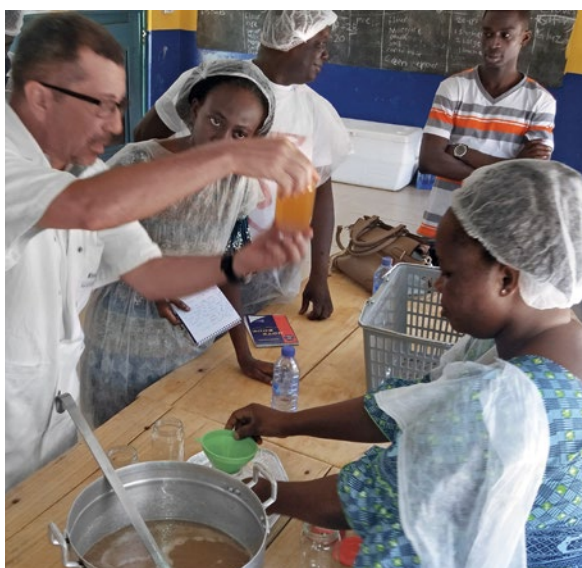
Curso de capacitación para la transformación de marañón ofrecido por expertas y expertos brasileños en Ghana

Gracias a la introducción de variedades de marañón de más alto rendimiento y mejor calidad y de tecnologías más eficientes de transformación de marañón, el Brasil y Alemania aumentaron conjuntamente con el Ministerio de Alimentación y Agricultura de Ghana (MOFA, por sus siglas en inglés) los ingresos de hogares campesinos ghaneses, redujeron la pobreza de las familias campesinas e incrementaron la seguridad alimentaria y nutricional de estas familias. Además, el proyecto contribuyó, a través de la plantación de árboles, a la mitigación del cambio climático y creó oportunidades de ingreso y empleo adicionales para mujeres.